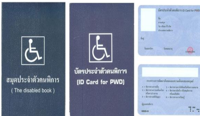
ตัวอย่างบัตรและสมุดประจำตัวคนพิการ

กรณีได้รับเบี้ยยังชีพคนพิการอยู่แล้ว และได้ย้ายเข้ามาในพื้นที่ตำบลแม่สลองนอก จะต้องมาขึ้นทะเบียนที่ องค์การบริหารส่วนตำบลแม่สลองนอกอีกครั้งหนึ่ง ภายใน 1-30 พฤศจิกายน